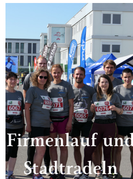
Firmenlauf und Stadtradeln