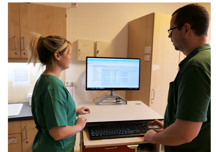
Wichtig ist den beiden angehenden Fachpflegeexperten der Austausch, beispielsweise auch zur EPA.

Insgesamt zehn Module werden an der Fachhochschule vermittelt, von Betriebswirtschaftslehre, rechtlichen Grundlagen und pflegewissenschaftlicher Theorie über Humanwissenschaft, psychiatrische Krankheitsbilder und Milieuthérapie bis hin zur allgemeinen Pflegeplanung und Gesprächstherapie. Jedes Modul wird mit einer Prüfung abgeschlossen, und am Ende der Weiterbildung ist eine stationsbezogene Abschlussarbeit einzureichen. Die ersten fünf Module haben die Pflegefachkräfte des SKH bereits bestanden.