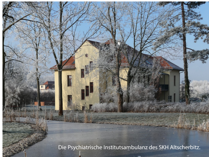
Die Psychiatrische Institutsambulanz des SKH Altscherbitz.

Seit Ende 2022 beginnen wir außerdem eine Vorschaltambulanz für unsere Station für junge Erwachsene zu etablieren. Ziel ist es,