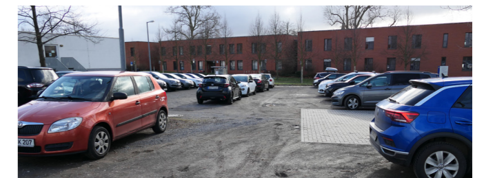
Parkplatz vorm Haus 10.

Die Bauunterlage ist erstellt, die Ausschreibung der Bauleistungen ist vorbereitet. Am 8. Februar hat das SIB Niederlassung Leipzig diese Unterlage noch einmal im Detail vorgestellt und den weiteren Bearbeitungsweg erläutert. Inhalt der Maßnahme ist neben der Erweiterung der Parkplätze um ca. 30 Stück, die Installation von zwei Doppelladesäulen für die Lademöglichkeit von vier Elektroautos. Ein überdachter eingezäunter Fahrradunterstand bietet Schutz und die gesicherte Abstellung von ca. 30 Fahrrädern. Auch hier wird die Möglichkeit geschaffen, E-Bikes aufzuladen. Ziel ist, im III. Quartal mit den Bauarbeiten zu beginnen.