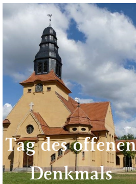
Tag des offenen Denkmals