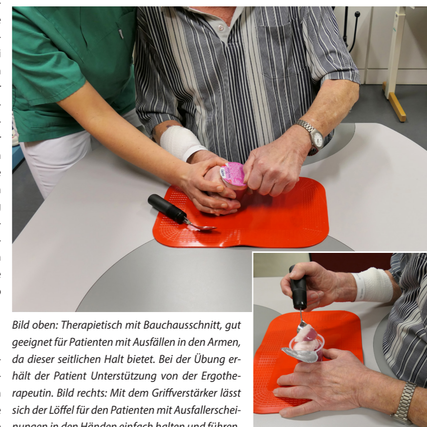
Bild oben: Therapietisch mit Bauchausschnitt, gut geeignet für Patienten mit Ausfällen in den Armen, da dieser seitlichen Halt bietet. Bei der Übung erhält der Patient Unterstützung von der Ergotherapeutin. Bild rechts: Mit dem Griffverstärker lässt sich der Löffel für den Patienten mit Ausfallerscheinungen in den Händen einfach halten und führen.

Seit Beginn dieses Jahres wird die ergotherapeutische Versorgung am Wochenende und an Feiertagen durch die Ergotherapie der Klinik abgedeckt. Zuvor erfolgte diese Absicherung durch externe Dienstleister. Dahingehend erfolgt aktuell die Einarbeitung der Ergotherapeuten des SKH Altscherbitz aus den Bereichen der Psychiatrie und Forensik.