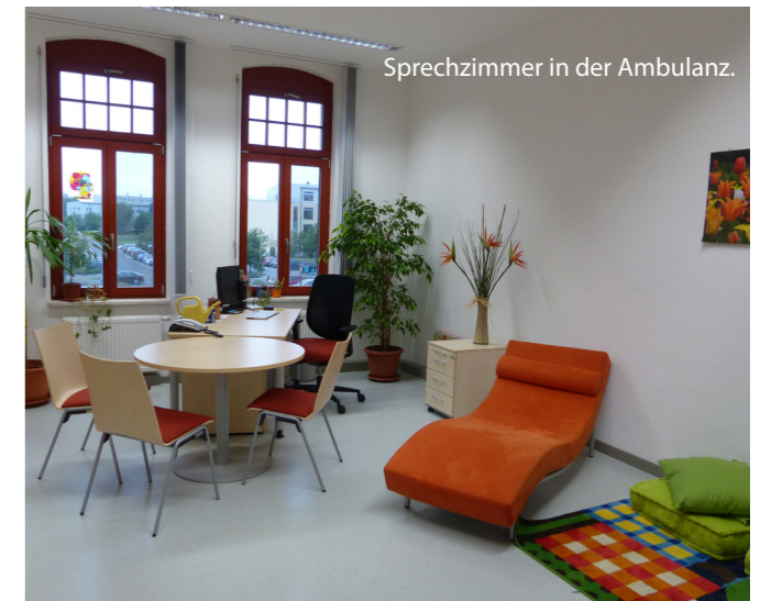
Sprechzimmer in der Ambulanz.

Sprechstunde orientiert sich dabei an den individuellen Bedürfnissen, Ressourcen und Herausforderungen der Patientin, um sie in ihrer neuen Rolle als Mutter unterstützen zu können.