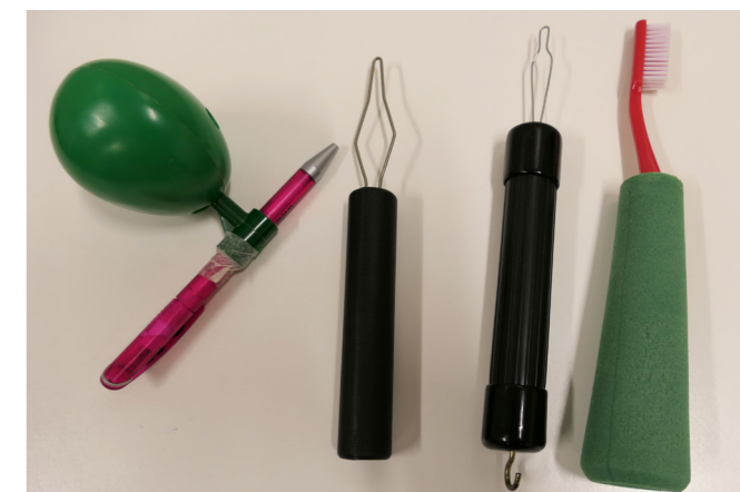
Hilfsmittel für Patienten mit neurologischen Ausfallerscheinungen in den Händen: ein Stifthalter, zwei verschieden große Knöpfhilfen und eine Zahnbürste mit Griffverdicker.

Mögliche Hilfsmittel sind anpassbare Therapietische und -stühle, Lagerungskissen bzw. -schlangen, griffverstärktes Besteck, Antirutschmatten und Universal-Griffverdicker, beispielsweise für Zahnbürsten und Rasierer. „Geh-Hilfen wie