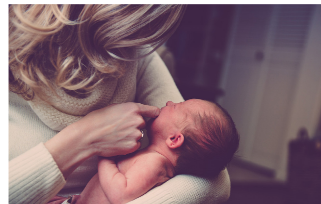
Jungen Müttern bietet die gynäko-psychiatrische Sprechstunde der PIA psychologischen Beistand.

Als weiteren Schritt erweitern wir unsere gynäko-psychiatrische Sprechstunde um die Möglichkeit von Diagnostik und stützenden Gesprächen bei Krisen rund um die Geburt. Ziel ist es, der Patientin einen Raum zu geben, ihre Probleme offen anzusprechen und praktische und schnell anwendbare Hilfen zu erarbeiten. Unsere