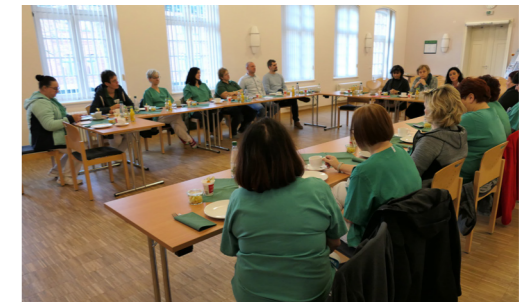
Beim Frühstück: Stationsleitungen und Krankenhausleitung des SKH.