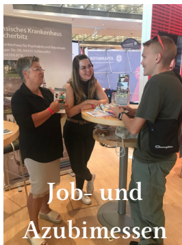
Job- und Azubimessen